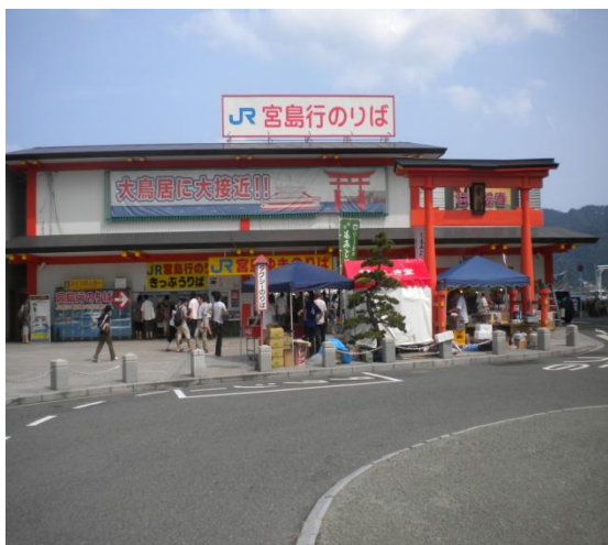
宮島口駅前にて撮影