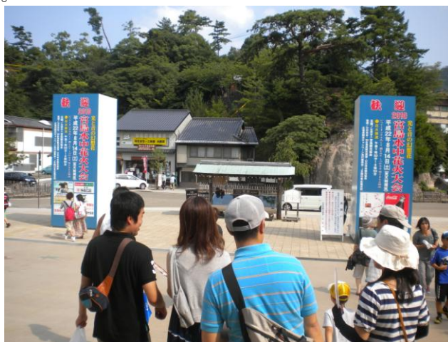
宮島の花火大会の告知板です。