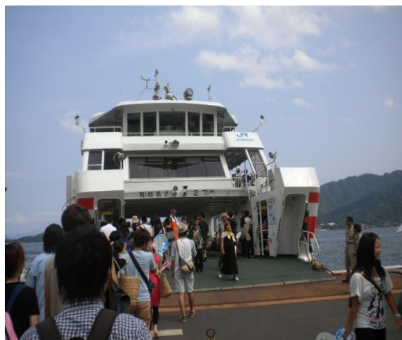
乗る直前にて撮影

この日はちょうど花火大会があったようで、ものすごい数の人々がフェリーに乗っていました。普段はもう少し空いていると思います。