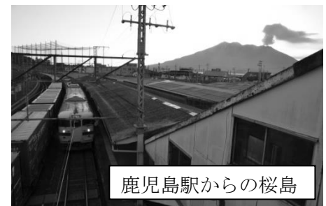
鹿児島駅からの桜島

鹿児島中央から昼の宮崎の日豊本線の集合列車を決め、自由行動。当時1年生の私を含めた三人は昨日車窓で見た桜島の美しさに魅了され、日の出前から鹿児島港へトワイライトの桜島を撮影に行きました。宮崎空港で宮崎ラーメンを食べ、大分へ一気に北上。大分では名物の鳥から揚げを食べ、投宿しました。